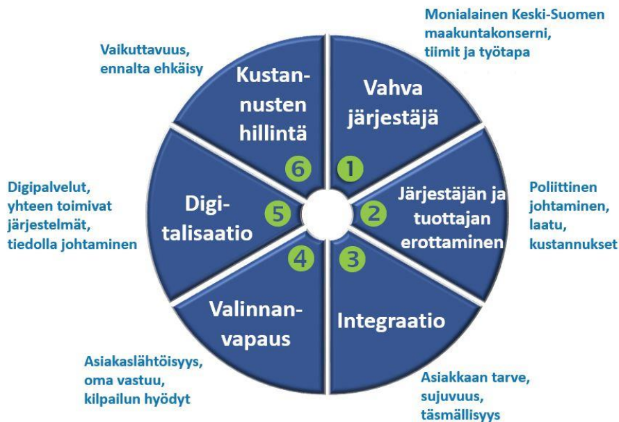
Kuva 3. Uudistuksen kulmakivet