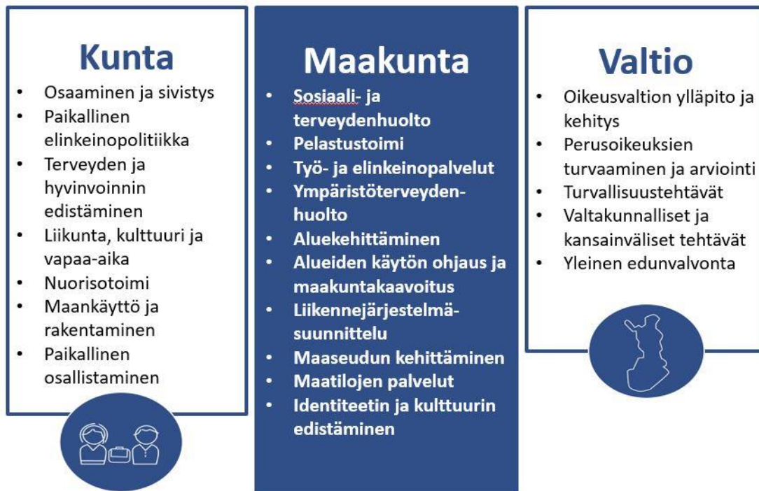
Kuva 2. Kunnan, maakunnan ja valtion tehtävät

Keski-Suomen maakunta on monialainen ja vahva palveluiden järjestäjä. Julkisten palveluiden rahoitus kulkee sen kautta. Maakunta vastaa palvelujen yhteensovittamisesta ja huomioi asiakkaiden erilaiset tarpeet. Asiakkaiden tasavertaisuus toteutuu yli kuntarajojen.