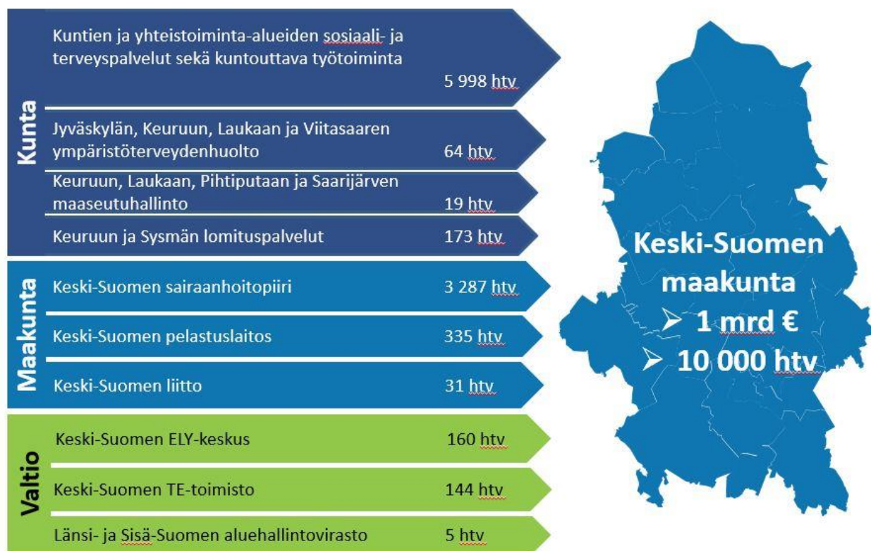
Kuva 1. Keski-Suomen maakunnan muodostajat

Uudistuksessa julkiset palvelut ja hallinto kootaan kolmelle tasolle: valtiolle, kunnille ja maakunnille. Kunnista, kuntien yhteistoiminta-alueilta, kuntayhtymiltä ja valtiolta siirtyvien palveluiden vastuu siirtyy yhdelle järjestäjälle - Keski-Suomen maakunnalle. Maakunnan kokoonpano muuttuu, kun Kuhmoisten kunta siirtyy Pirkanmaan maakuntaan.